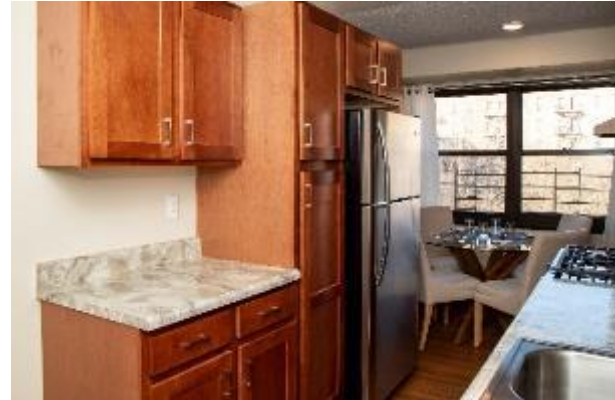
Apartamento renovado en Twin Parks West