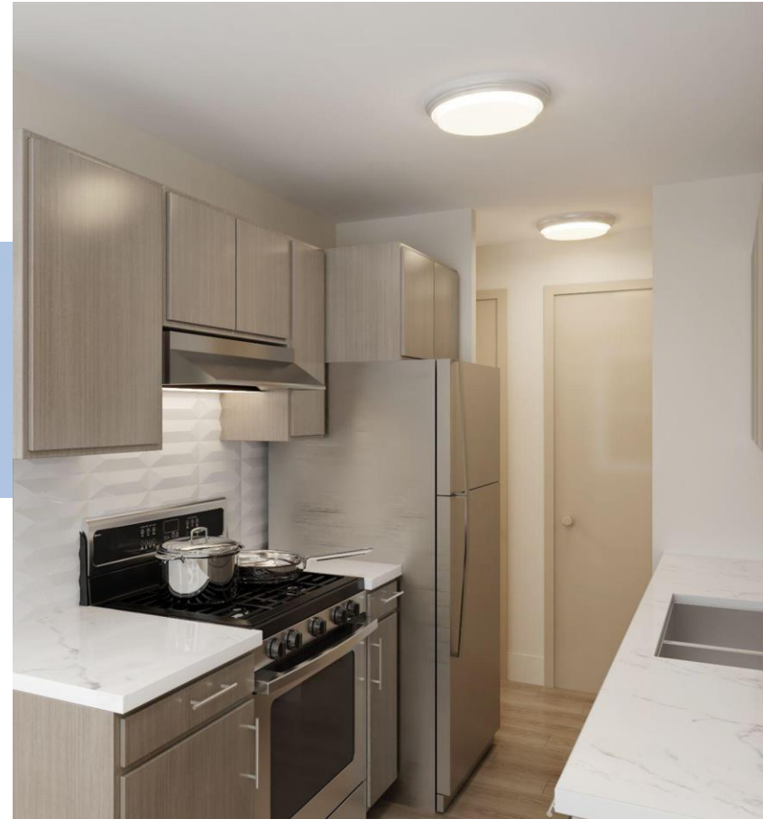
Render de cocina básica