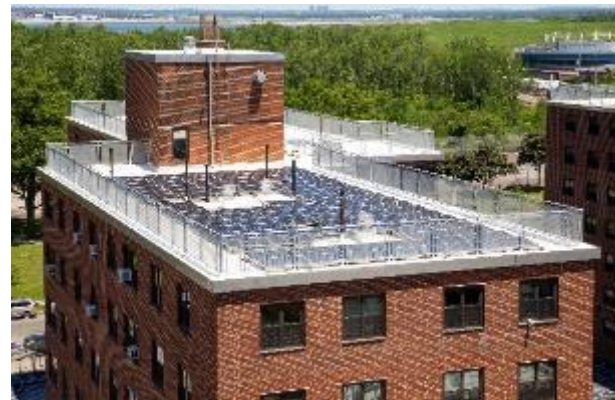
Reparación de techo y sistema de paneles solares en Ocean Bay (Bayside)