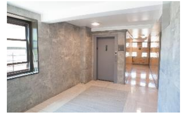
Entrada del edificio renovado en Ocean Bay (Bayside)