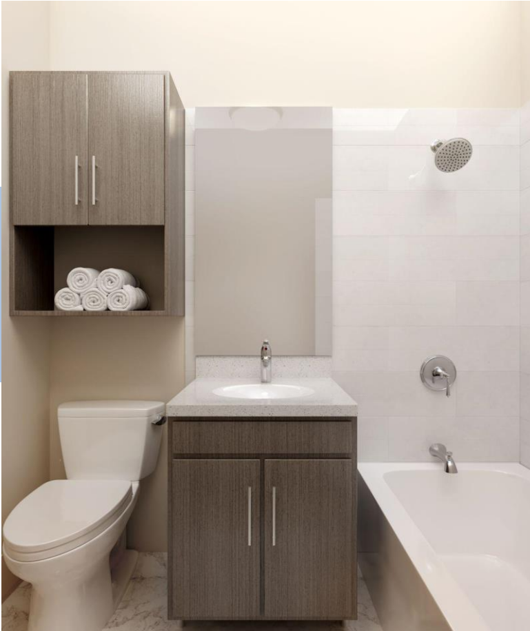
Render de baño básico

Tours de apartamentos modelo Tuvo lugar el 31/10 y el 7/11