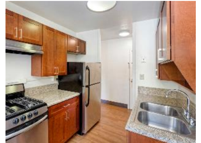
Ocean Bay (Bayside)