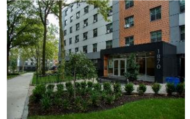
Mejoras en Baychester